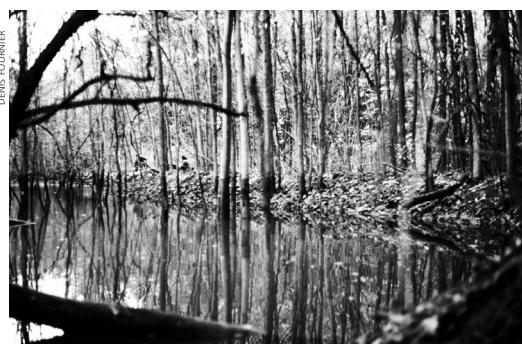
Le castor, après l'homme, est l'animal qui modifie le plus son environnement.