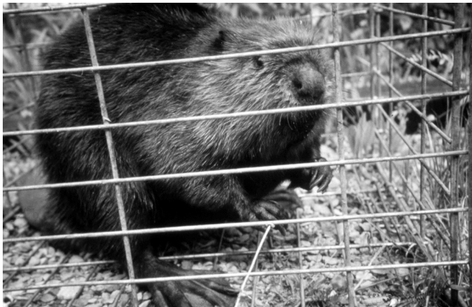
Castor femelle avant d'être marquée, puis relâchée