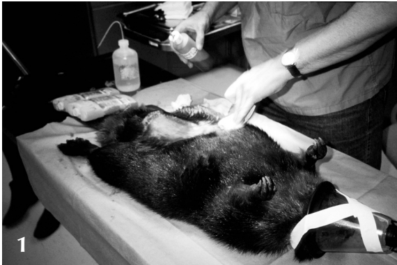
1. Anesthésie du castor mâle et préparation à la chirurgie; 2. Chirurgie; 3. Post-chirurgie.