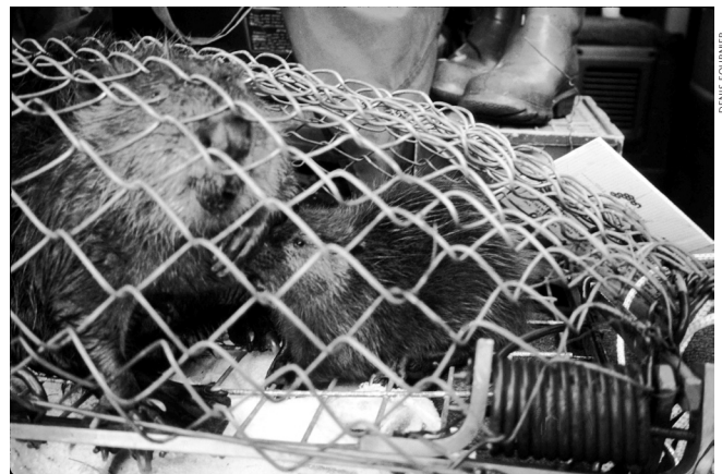
Piège à capture vivant Hancock

Quatre mâles de quatre colonies ont été stérilisés par vasectomie entre 1995 et 1997 et ont été suivis jusqu'en 2002. Sur les quatre colonies, deux couples ont été confirmés aux mêmes endroits en 2002 tout en maintenant la cohésion de leurs liens familiaux durant au moins cinq ans. Un autre couple s'est maintenu pendant deux ans, puis a disparu. Le mâle a été retrouvé quatre ans plus tard à l'intérieur d'un autre parc à quelques kilomètres de l'endroit initial avec une autre femelle. Le quatrième couple s'est maintenu pendant deux ans, puis il a disparu. Nous avons retrouvé la femelle en lactation avec un autre mâle, quatre ans plus tard dans un autre secteur. Le mâle stérilisé est réapparu près de l'endroit initial cinq ans après la chirurgie, avec une nouvelle compagne qui n'était pas en lactation.